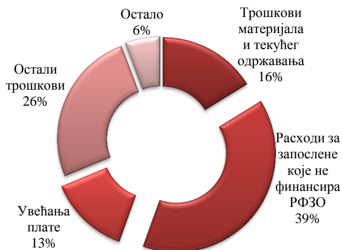
Слика број 2: Структура исказаних расхода и издатака из осталих извора у Дому здравља за 2017. годину

Од укупно извршених расхода и издатака Дома здравља из осталих извора у 2017. години 13% се односи на извршене расходе по основу обрачунатих и исплаћених увећања плата запосленима.